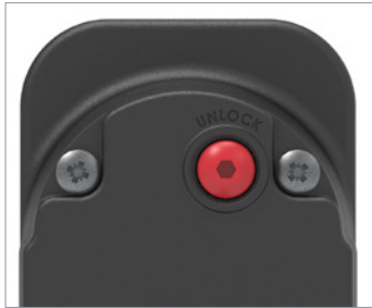
Manual (emergency) activation Manuelle (Not-) Betätigung